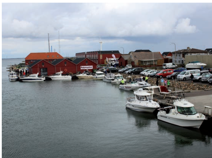
Småbådene ligger klar i Thorsminde Havn.

Fjorden skulle efter sigende have en god bestand af brasen, aborrer, gedder og skrubber. Der er dog grejmæssigt langt fra fiskeri i Nordsøen, til fiskeri i en ekstremt lavvandet fjord, hvilket dagens fangster også bar præg af. Langt de fleste både kom i havn